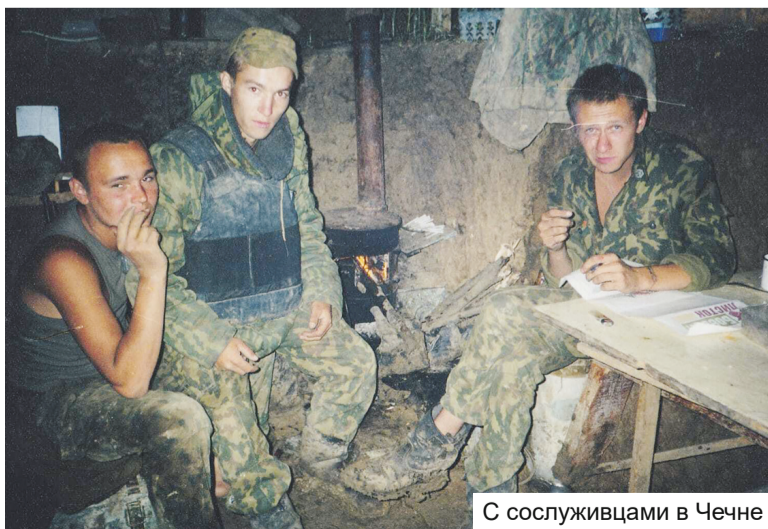
С сослуживцами в Чечне