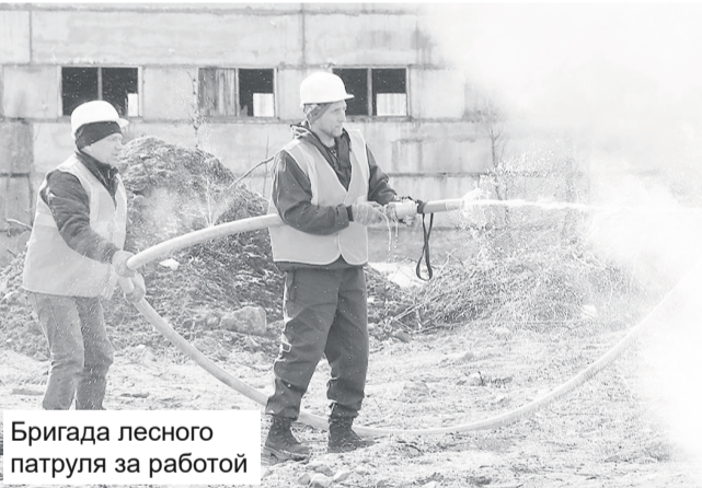
Бригада лесного патруля за работой

В России наступил новый весенне-летний пожароопасный период. После таяния снега и ухода талой воды резко возрастает опасность возгораний. Беспечное, неосторожное обращение с огнём при сжигании сухой травы, мусора, или детские шалости со спичками зачастую оборачиваются большой бедой.