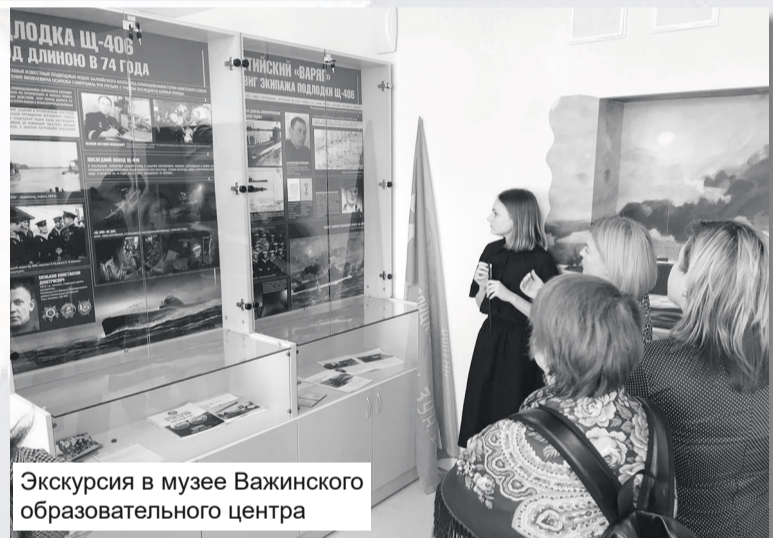
Экскурсия в музее Важинского образовательного центра

- Я веду уроки и внеурочную деятельность. Наблюдая за ребятами, могу сказать, что осознание, наверно, приходит с возрастом. Если начальная школа проявляет просто пылкий интерес, приходя в музей, скорее даже любопытство: что же здесь находится, заглядывают во все уголки, рассматривают экспонаты, то десятый класс уже ходит сюда осознанно. Чем старше ребята становятся, тем больше проявляется интерес к истории,